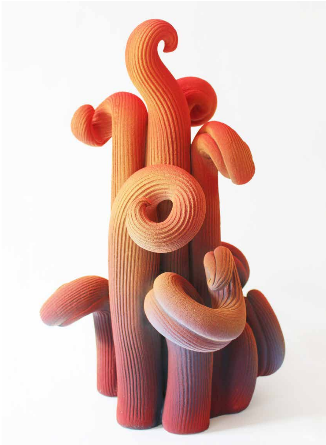
Bloom n°1, 2023, Grés chamotté émaillé H57 x 40 x 37 cm ©Claire Lindner