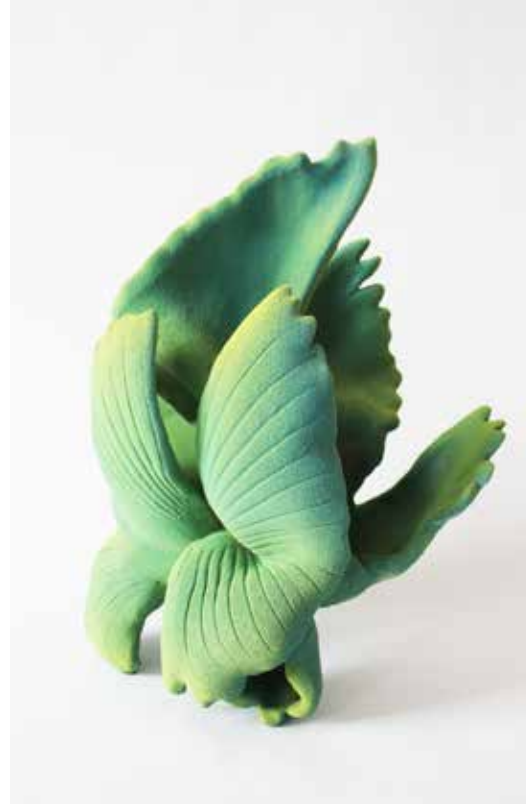
Envol n°2, 2023, Grés chamotté émaillé, Ailes de bécasse, H36 x 26 x 18 cm ©Claire Lindner