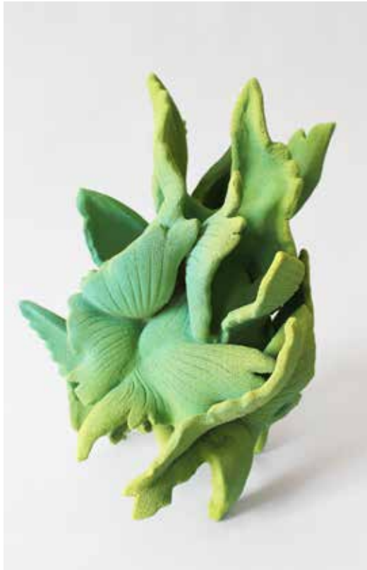
Envol n°1, 2023, Grés chamotté émaillé, Ailes de bécassine, H35 x 26 x 27 cm ©Claire Lindner

De fait, chez Claire Lindner, la nature n'est pas un élément du décor : « elle est le sujet ». Ce qui semble prendre tout son sens à une époque où les préoccupations environnementales sont à placer au premier plan.